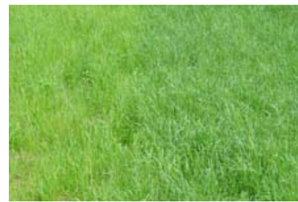
Auch bei Grünland ist der CULTAN-Effekt selbst bei Trockenheit nach kurzer Zeit leicht zu erkennen: links keine N-Düngung, rechts Brinamon ca. 40 kgN/ha (Juni 07, Rickenbach-Attikon ZH).