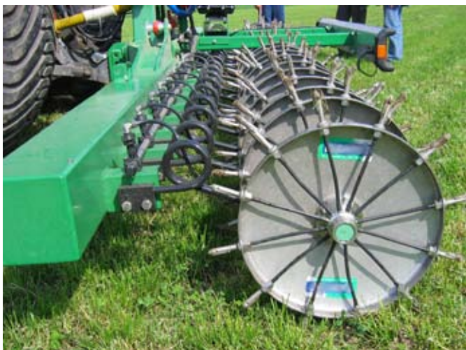
Injektorräder für die punktförmige Ammonium-Applikation bei Engreihenkulturen und Grünland. Die sternförmigen Injektornippel sind am Ende verschlossen. Der Flüssigkeitsaustritt erfolgt durch seitliche Öffnungen zum Zeitpunkt, in dem die Nippel in den Boden einstecken. Durch Pendelaufhängung und Federbelastung der Einzelaggregate wird eine gleichmässige Tiefenführung erreicht.

Getreide: Die Vergleiche bei Getreide zeigen beim CULTAN zwar geringere Unterschiede als bei Kartoffeln, in keinem Versuch jedoch Ertrags- und Qualitätsnachteile im Vergleich mit KAS. Nebst gleichen oder tendenziell etwas höheren Erträgen und Qualitäten resultierten teils gesicherte Mehrerträge und signifikant höhere Rohproteingehalte. In Vergleichen mit stabilisierten Stickstoffdüngern (ENTEC), denen sog. Nitrifikationshemmer zugefügt werden, ergaben sich beim CULTAN etwa gleich hohe Erträge. Die Injektion in den Boden wird etwas vorteilhafter beurteilt als ein Oberflächendepot mit der Schleppschlauchapplikation. Eine Versuchsreihe lässt den Schluss zu, dass bei Winterweizen und frühzeitiger CULTAN-Behandlung auf eine N-Spättdüngung nicht verzichtet werden sollte.