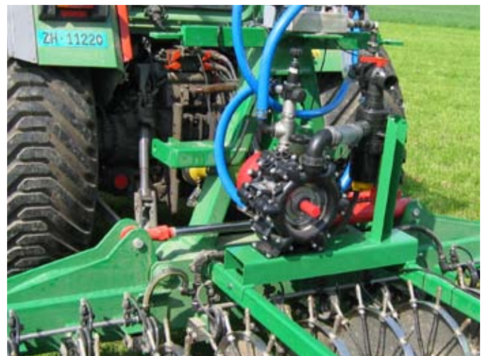
Die Membranpumpe und die Regelventile des Injektorgertes werden durch einen Mikroprozessor gesteuert. Die gewünschte Applikationsmenge kann so unabhängig von der Arbeitsgeschwindigkeit eingehalten werden. Die Schaummarkierung an den Radträgerenden ermöglicht bei allen Feldverhältnissen ein exaktes Anschlussfahren.