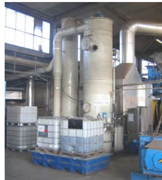
Ammoniakstrippanlage für die Herstellung von Ammoniumsulfatlösung (Brinamon). Das aus einem Fabrikationsprozess anfallende Ammonium wird im Luftstrom als Ammoniak ausgetrieben und im nachfolgenden Prozess ausgewaschen und an Säure gebunden.