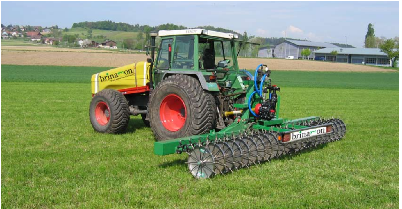
Radinjektor mit Traktor und Düngertank.